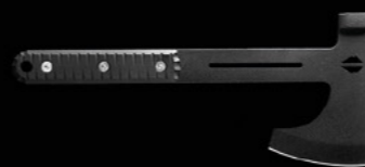
Trekking Axe FLOKI Сокира ФЛОКІ